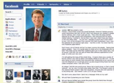
Facebook ของ Bill Gates

สามารถสมัครเป็นสมาชิกได้ที่ www.facebook.com