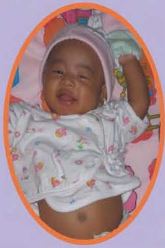
น้องภูมิจิ