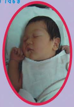
น้องต้นไผ่