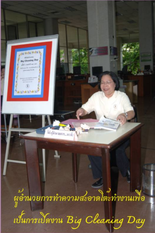
ผู้อำนวยการทำความสะอาดโต๊ะทำงานเพื่อ เป็นการเปิดงาน Big Cleaning Day

คำขวัญ 5ส ประจำปี 2551 '5ส คือ รากฐาน บริการ คือ หัวใจ'