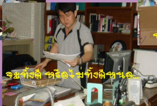
จัดโต๊ะทำงานให้สะอาด