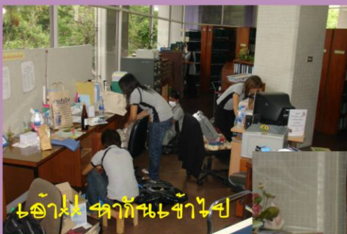
โต๊ะทำงานสะอาด