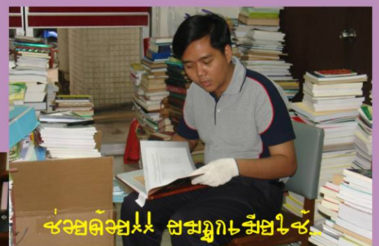
ช่วยด้วย!! สมบูรณ์