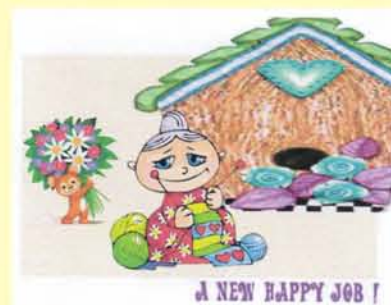
A NEW HAPPY JOB!

จาก ทนึ่ง บั้ม บั้ม อังเออร กุหลาบ ทัลยาณี